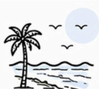
Playas de Tijuana