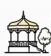
Parque Miguel Hidalgo