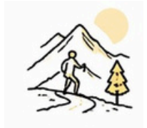
Senderismo y naturaleza