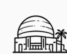
CECUT (Centro Cultural Tijuana)