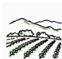
Valle de Guadalupe